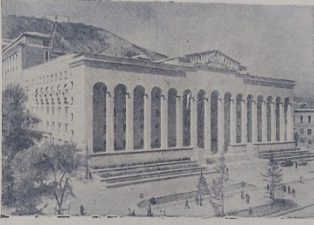
Тбилиси. Новый Дом правительства Грузинской ССР.

Первый хлеб — государству ЛЕНИН-КИПШАК (Самаркандская область). (ТАСС). Выходы фермерского района имени Толкина и имени Кирова слава на гостеприимный пиршество первых центнеров зерна нового урожая. Сиродовальные блоки ОБЕССА (ТАСС). Обесский ремонтный завод Министерства сельского хозяйства и заготовок Украинской ССР приступил к серийному выпуску сиродовальных блоков. Блок устанавливается на сцепку, и ее выводит в работу. Через него проходит тракторная тяга. Металлическая спиральная рама, из которой сделан блок, не позволяет ему деформироваться в работе. С помощью этого приспособления тракторной тягой можно вытаскивать по склону на десятиградусном уклоне более трех тонн осыпавшихся камней. Применение блоков повышает производительность бригады.