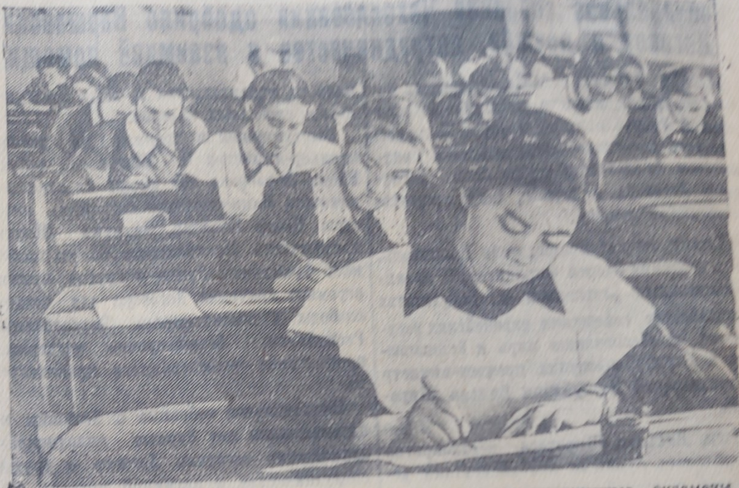
25 мая в десятых классах школ области начались выпускные экзамены. В первый день экзаменов выпускники писали сочинение. На снимке: ученики десятого класса Усть-Каменогорской средней школы имени Ушанова пишут сочинение.