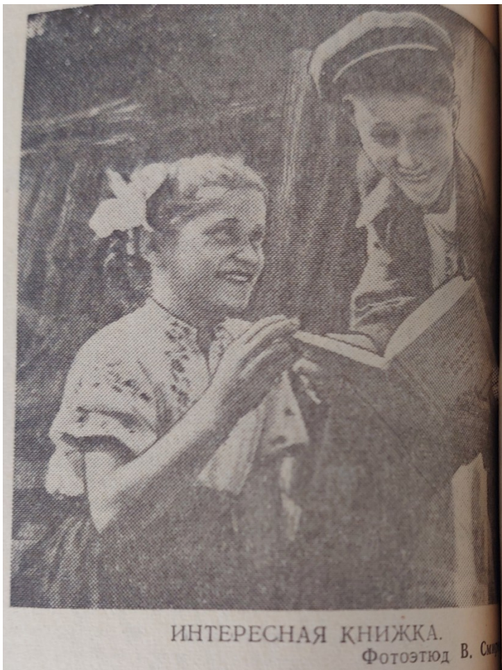
ИНТЕРЕСНАЯ КНИЖКА.