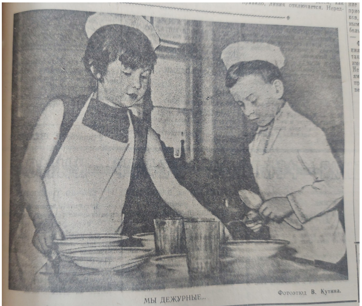
11. Фото дети, 1 мая