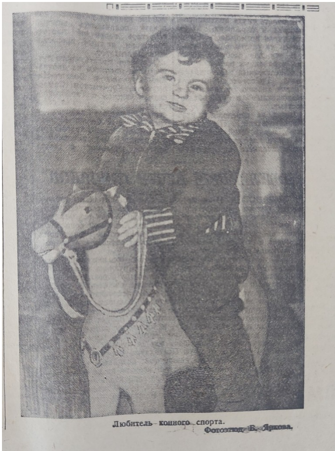
Любитель конного спорта.