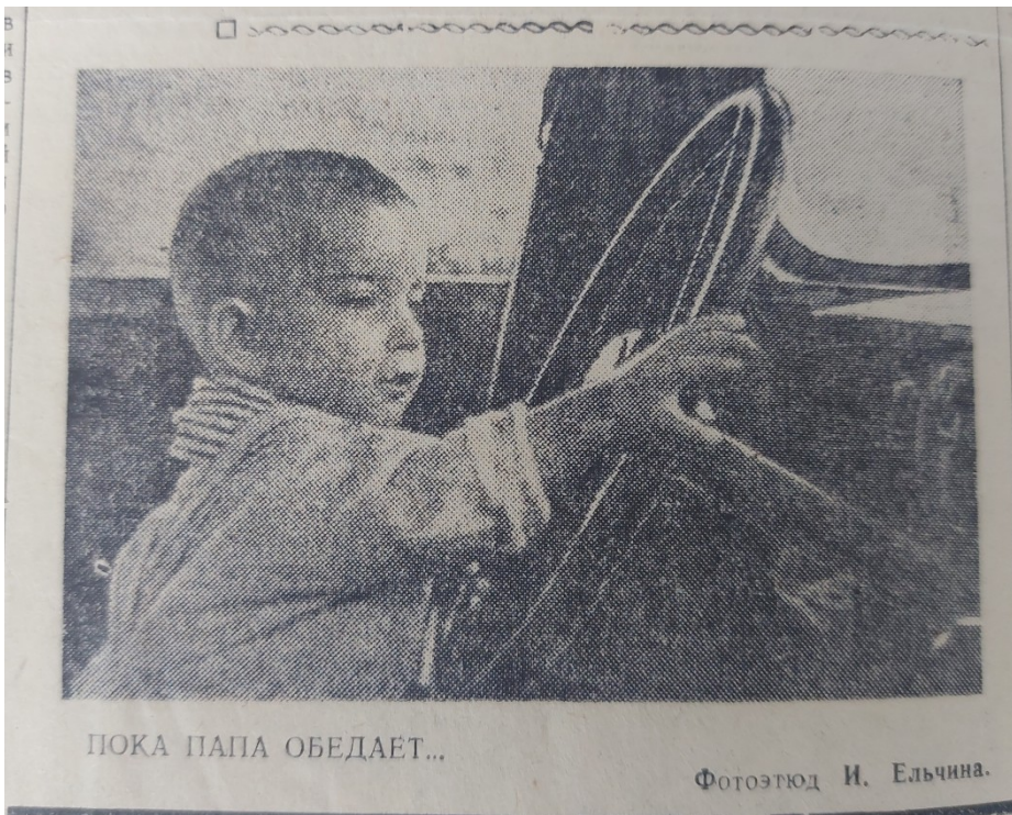
ПОКА ПАПА ОБЕДАЕТ...